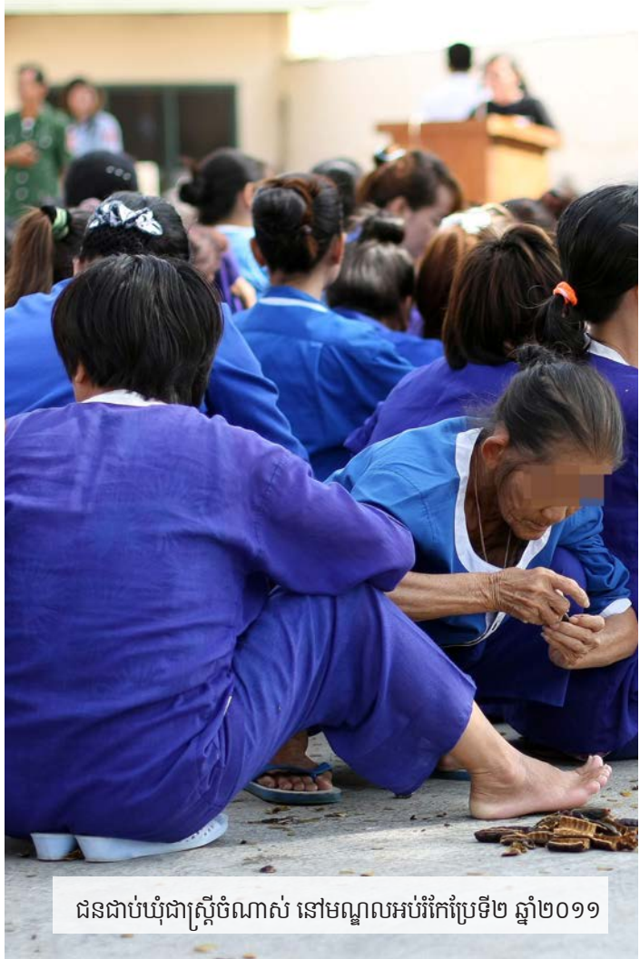
ជនជាប់ឃុំជាស្ត្រីចំណាស់ នៅមណ្ឌលអប់រំកែប្រែទី២ ឆ្នាំ២០១១

“មន្ត្រីពន្ធនាគារមិនខ្វល់ ប្រសើរឃើញជាប់ឃុំចង់ធ្វើ អត្តឃាត។ ឥរិយាបថរបស់អ្នកទាំងនោះ គឺថា ប្រសិនបើអ្នកចង់ សម្លាប់ខ្លួន សូមអញ្ជើញ។ ពេលដែលខ្ញុំប្រាប់មន្ត្រីពន្ធនាគារលើក ដំបូងថា ខ្ញុំមានអារម្មណ៍ចង់ធ្វើអត្តឃាត មន្ត្រីពន្ធនាគារបានស្តី បន្ទោសឲ្យខ្ញុំ ហើយប្រាប់ខ្ញុំថា ពួកគាត់នឹងមិនអនុញ្ញាតឲ្យគ្រួសារខ្ញុំ មកសួរសុខទុក្ខខ្ញុំទៀតទេ។”