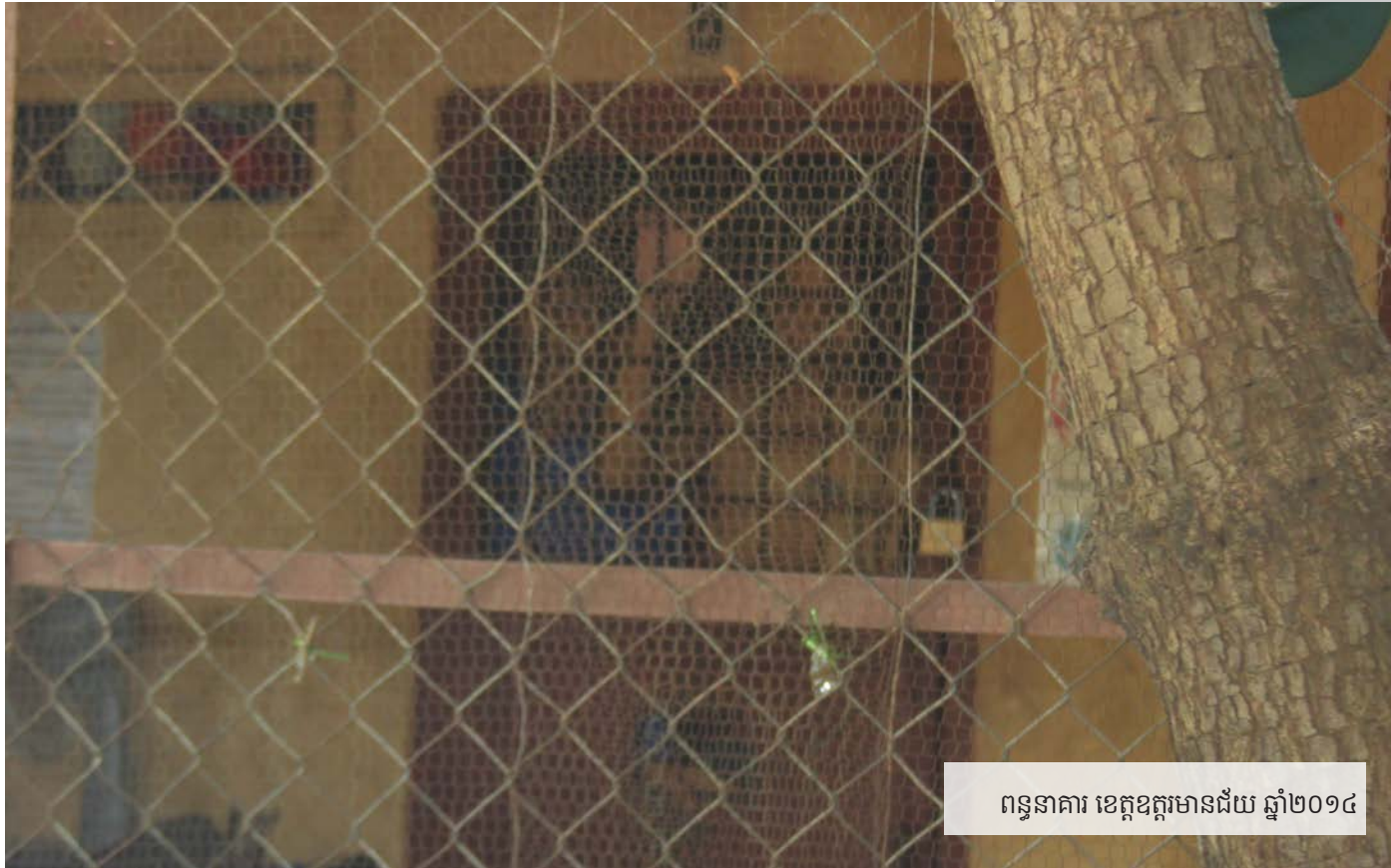
ពន្ធនាគារ ខេត្តឧត្តរមានជ័យ ឆ្នាំ២០១៤

រចនាសម្ព័ន្ធគ្រប់គ្រង ក្នុងបន្ទប់ឃុំឃាំង ដែលលក្ខណៈមិនផ្លូវការ និងមិនមានការ គ្រប់គ្រង រួមមាន មេបន្ទប់ និងមេបន្ទប់ រង។ អ្នកទាំងនោះត្រូវបានជ្រើសតាំង ដោយសារភក្តីភាព ចំពោះថ្នាក់គ្រប់គ្រង ពន្ធនាគារ ហើយពួកគេជាអ្នកបង្កើត និង អនុវត្តវិន័យពន្ធនាគារដ៏មានប្រសិទ្ធភាព ហើយ អនុវត្តប្រព័ន្ធស្រដៀងគ្នានៃការ គ្រប់គ្រងពន្ធនាគារ ដែលយកវិន័យរបស់ ពួកគាត់ ជាជាងវិន័យ និងនីតិវិធី ផ្លូវការ។ ហេតុដូច្នេះនេះ មេបន្ទប់ និងសមាជិកនៃ គណៈកម្មាធិការគ្រប់គ្រង ក្នុងបន្ទប់ ប្រព្រឹត្តទៅដោយមាននិទណ្ឌភាព ហើយ ជាទម្លាប់ វាយដំជនជាប់ឃុំថ្មី ជាការ "ស្វាគមន៍" ចំពោះជីវិតក្នុងពន្ធនាគារ ហើយអាចប្រព្រឹត្តអំពើហិង្សាដល់ជនជា ប់ឃុំដទៃទៀត ក្នុងនាមថាដាក់វិន័យ។ ការវាយដំបែបនេះ ជារឿងៗកើតឡើង ហើយឃោឃៅ ហើយអ្នកដែលក្លាយជន រងគ្រោះ មិនមានមធ្យោបាយក្នុងការប្តឹង ផ្តល់នោះទេ។