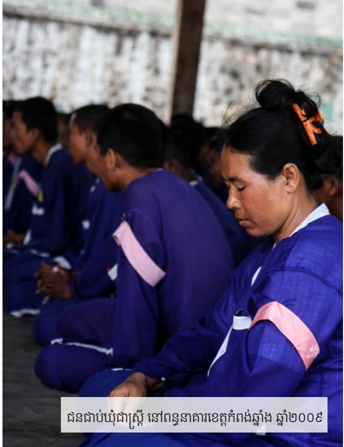
ជនជាប់ឃុំជាស្ត្រី នៅពន្ធនាគារខេត្តកំពង់ឆ្នាំង ឆ្នាំ២០០៩

យោងតាមលទ្ធផលនៃការស្ទាបស្ទង់នាពេលថ្មីៗនេះ ជា មួយជនជាប់ឃុំ ៤៧៩ នាក់ អង្គការលីកាដូ បានរកឃើញថា ជាងមួយ ភាគបី ក្នុងចំណោមអ្នកទាំងនោះ ត្រូវបានចោទប្រកាន់ឬ កាត់ទោសពី បទល្មើស ទាក់ទងនឹងគ្រឿងញៀន ខណៈដែល ៣១ ភាគរយ ផ្សេង ទៀត បានជាប់ក្នុងពន្ធនាគារ ដោយសារបទល្មើសតូចតាច ដូចជា លួច ទទួលផលចោរកម្ម រំលោភសេចក្តីទុកចិត្ត បំផ្លិចបំផ្លាញទ្រព្យ សម្បត្តិ និងនេសាទខុសច្បាប់។ គិតត្រឹមពាក់កណ្តាល ខែកញ្ញា ឆ្នាំ២០១៤ ៧០ភាគរយនៃនារីក្នុងពន្ធនាគារ ស្ថិតក្នុងការឃុំខ្លួនបណ្តោះ អាសន្នរង់ចាំសវនាការ រួមទាំងអ្នករង់ចាំបណ្តឹងឧទ្ធរណ៍ ឬ សាលក្រម ស្ថាពរ (តុលាការកំពូល)។ បើទោះជាអង្គការលីកាដូ មិនមានស្ថិតិអំពី ចំនួននារីដែលមានការទទួលខុសត្រូវថែទាំកូនក៏ដោយ តួលេខទំនង ជាខ្ពស់។