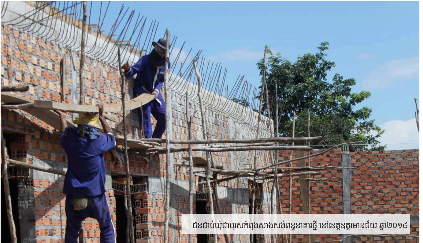
ជនជាប់ឃុំជាបុរសកំពុងសាងសង់ពន្ធនាគារថ្មី នៅខេត្តឧត្តរមានជ័យ ឆ្នាំ២០១៤