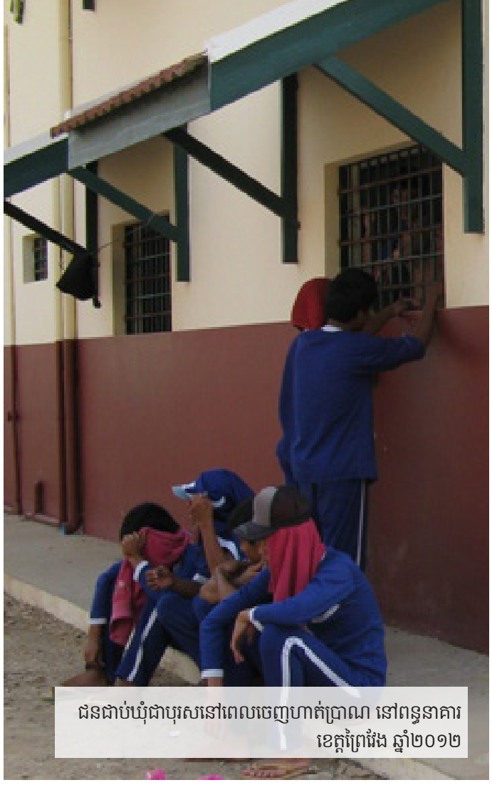
ជនជាប់ឃុំជាបុរសនៅពេលចេញហាត់ប្រាណ នៅពន្ធនាគារ ខេត្តព្រៃវែង ឆ្នាំ២០១២