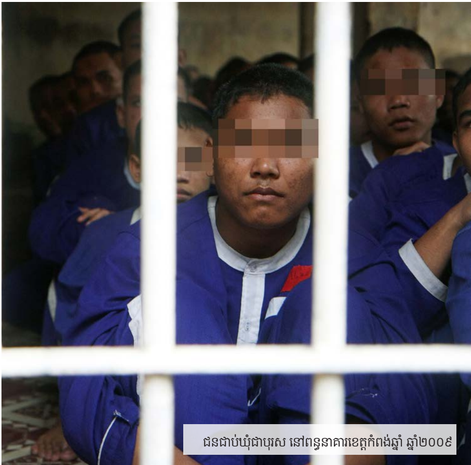
ជនជាប់ឃុំជាបុរស នៅពន្ធនាគារខត្តកំពង់ឆ្នាំ ឆ្នាំ២០០៩

សូម្បីតែស្នាក់នៅក្នុងបន្ទប់ជាមួយគ្នា ជន ជាប់ឃុំខ្លះទទួលបានទំហំធំជាងជនជាប់ ឃុំដទៃទៀត ដោយសារឋានៈសង្គម ឬ ស្ថានភាពហិរញ្ញវត្ថុ។ ជនជាប់ឃុំដែលត្រូវ បានដោះលែង បានរាយការណ៍មក អង្គការលើកកម្ពុជា ថា ជនជាប់ឃុំដែលមាន ប្រាក់បង់ បានទទួលបានដំណេកនៅលើ ធ្នើរ ខណៈជនជាប់ឃុំដែលអត់មានប្រាក់ បង់ ត្រូវទទួលបានដំណេកនៅលើកម្រាល អីដ្ឋ។ ជនជាប់ ឃុំដែលមានធនធានតិច ជាងគេ ជាទូទៅទទួលបានដំណេកនៅ លើកម្រាលអីដ្ឋក្បែរបន្ទប់ទឹក ហើយជា ញឹកញាប់ ត្រូវគេដើរជាន់នាពេលយប់។