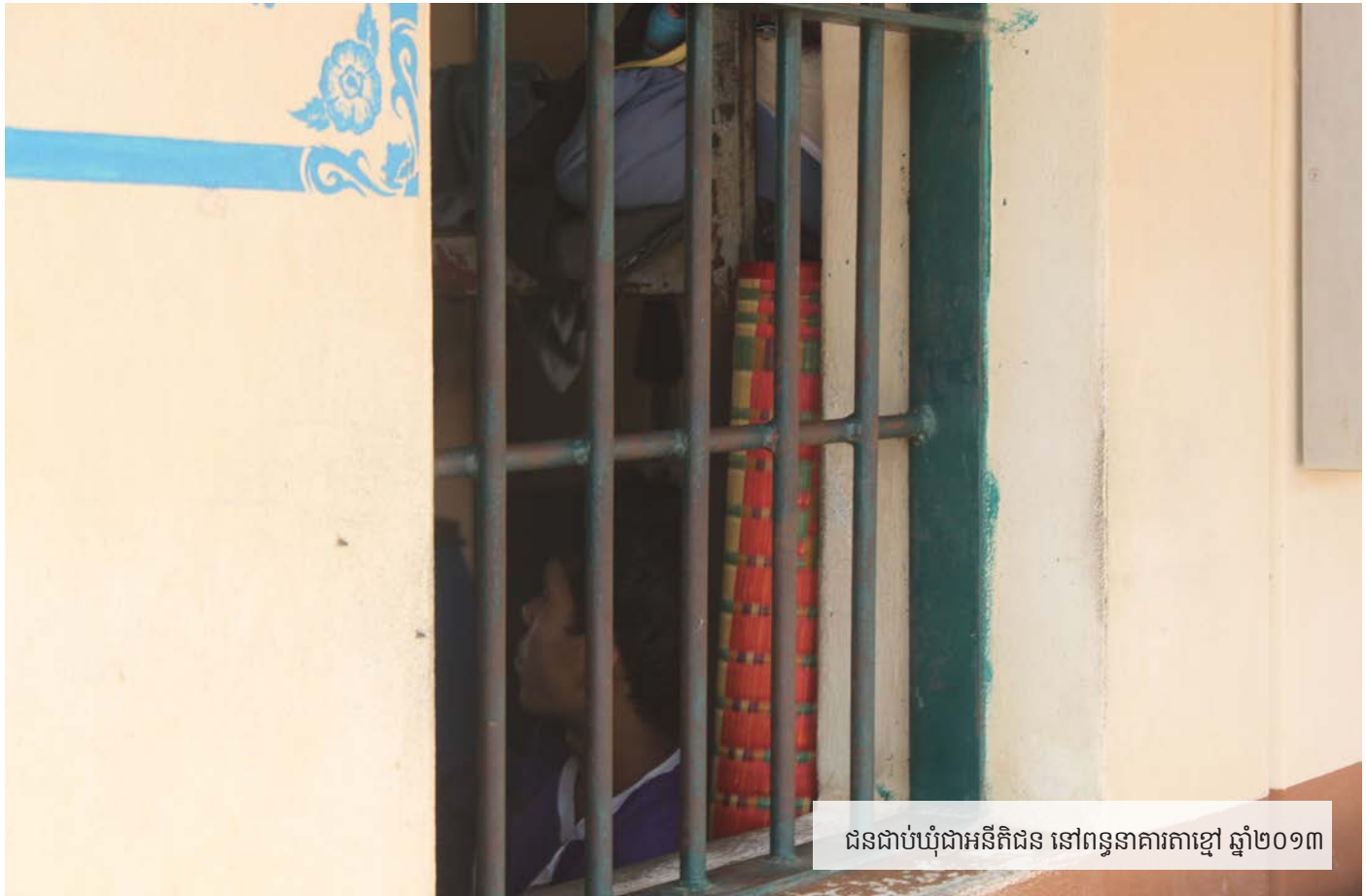
ជនជាប់ឃុំជាអនីតិជន នៅពន្ធនាគារតាខ្មៅ ឆ្នាំ២០១៣

ដូចគ្នានឹងនីតិជនផងដែរ អនីតិជននៅក្នុងពន្ធនាគារកម្ពុជា មិនមានការការពារ និងយន្តការដែលមានប្រសិទ្ធភាព ក្នុងការប្តឹងអំពី ការធ្វើទារុណកម្ម និងការប្រព្រឹត្តិមិនសមរម្យនោះទេ។ ពួកគាត់ រាយការណ៍អំពីការវាយ ទាត់ ទះ ដោយជនជាប់ឃុំដទៃទៀត ហើយពេល ខ្លះ ក្រោមបញ្ជាពីមន្ត្រីពន្ធនាគារ។ នេះរួមទាំងការវាយដំទៅលើជនជា ប់ឃុំពេលដែលមកដល់ពន្ធនាគារដំបូង និងការដាក់ទណ្ឌកម្មចំពោះ ការធ្វើខុសបន្តិចបន្តួចពីបទបញ្ជាក្នុងពន្ធនាគារ។