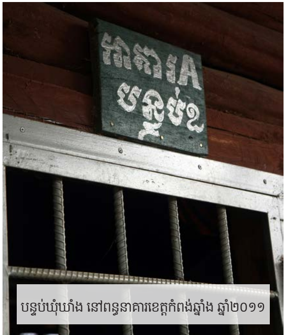
បន្ទប់ឃុំឃាំង នៅពន្ធនាគារខេត្តកំពង់ឆ្នាំង ឆ្នាំ២០១១