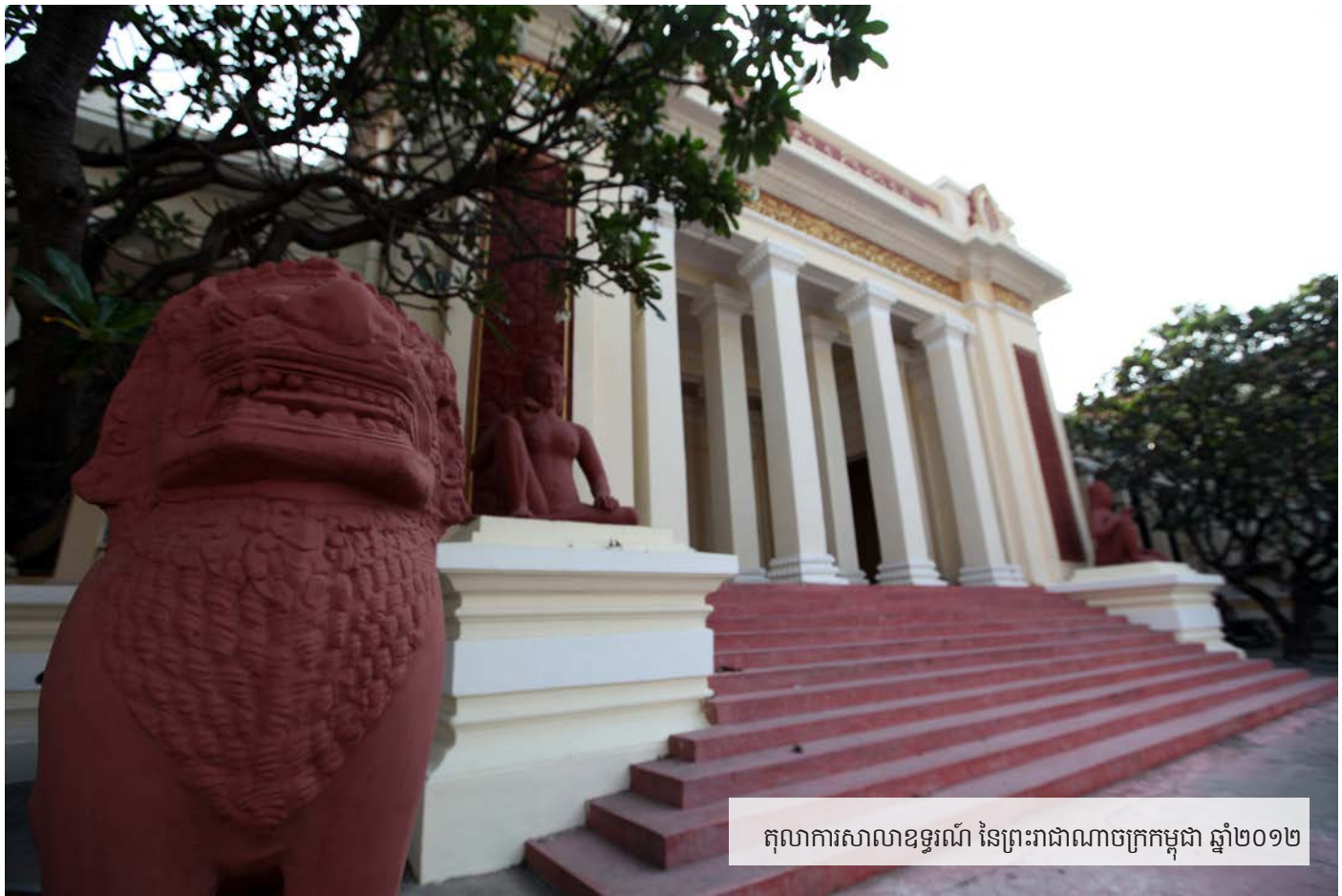
តុលាការសាលាឧទ្ធរណ៍ នៃព្រះរាជាណាចក្រកម្ពុជា ឆ្នាំ២០១២

តាមច្បាប់ថ្មីទាំងនេះ រដ្ឋមន្ត្រីក្រសួងយុត្តិធម៌ ត្រូវបានចាត់ តាំងឲ្យត្រួតត្រាយ៉ាងខ្លាំង ទៅលើឧត្តមក្រុមប្រឹក្សានៃអង្គចៅក្រមដែល មានអំណាចសម្រេច លើចរិការបស់ឧត្តមក្រុមប្រឹក្សានៃអង្គចៅក្រម និងជា អ្នកកំណត់សម្រេច ថាតើ ត្រូវចាត់វិធានការចំពោះចៅក្រម ឬ ព្រះរាជ អាជ្ញា ឬ អត់។ ចៅក្រម និងព្រះរាជអាជ្ញានឹងត្រូវរួមបញ្ចូលទៅក្នុងក្រប ខណ្ឌរដ្ឋបាលរបស់ក្រសួងយុត្តិធម៌ ហើយមន្ត្រីជាន់ខ្ពស់របស់ក្រសួង យុត្តិធម៌នឹងធ្វើជាប្រធានគណៈកម្មការការពារ ក្នុងការសម្រេចតំឡើង ឋានៈដល់ចៅក្រម។ រដ្ឋមន្ត្រីក្រសួងយុត្តិធម៌ក៏មានអំណាចខ្លះផងដែរ