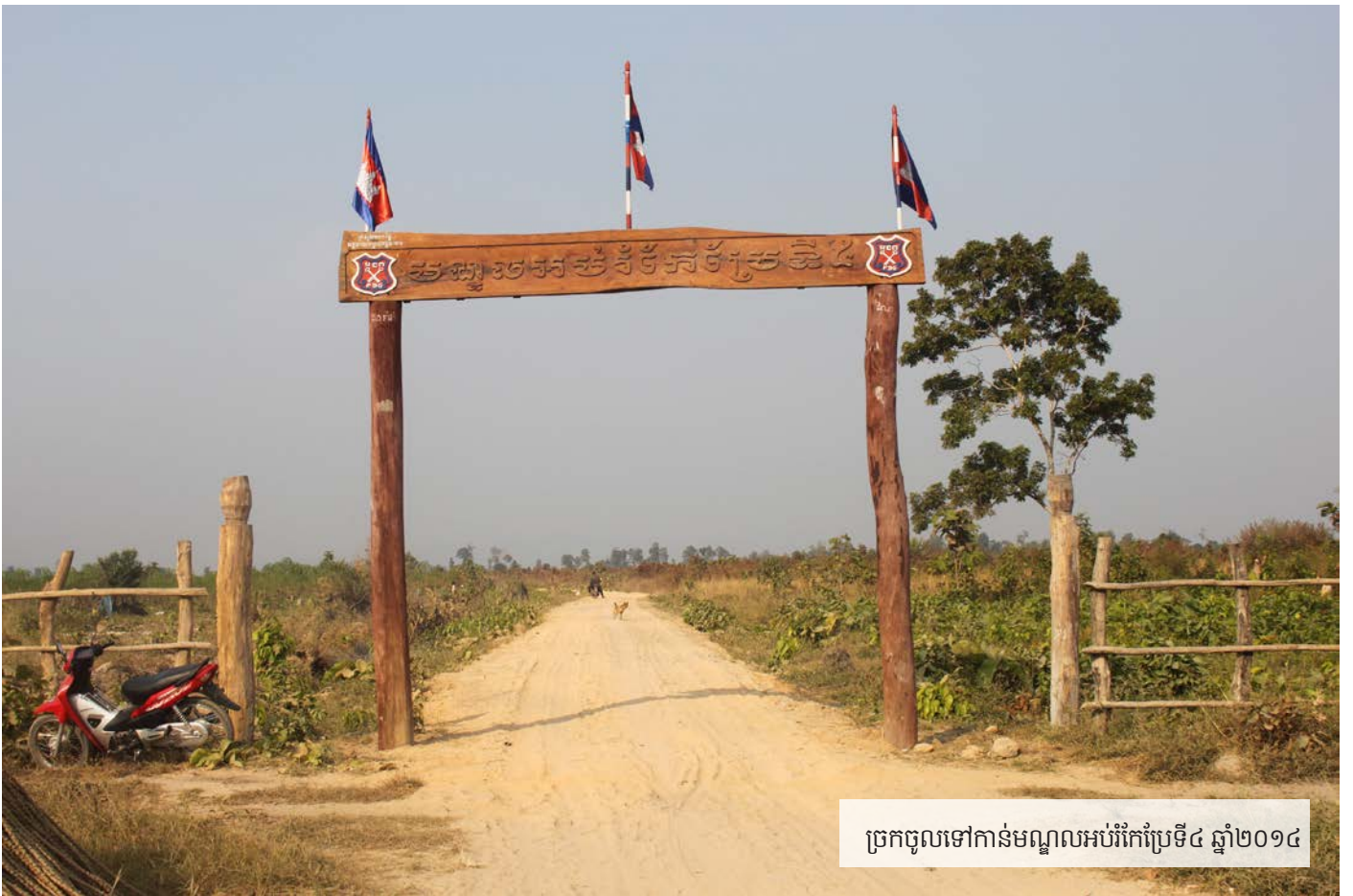
ច្រកចូលទៅកាន់មណ្ឌលអប់រំកែប្រែទី៤ ឆ្នាំ២០១៤