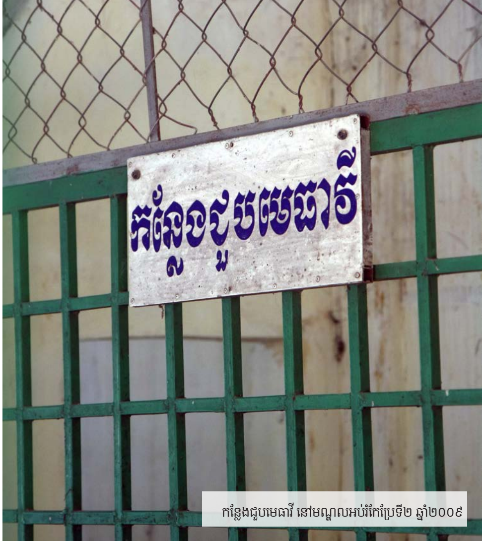
កន្លែងជួបមេធាវី នៅមណ្ឌលអប់រំកែប្រែទី២ ឆ្នាំ២០០៩

កាលពីថ្ងៃទី១៥ ខែកញ្ញា ឆ្នាំ២០១៣ ពេលដែលនគរបាលបាញ់ប្រហារ និង សម្លាប់អ្នក ឈរមើលដែលមិនមាន កំហុសម្នាក់ និងបាញ់គ្រាប់កាំភ្លើងពិត មកលើក្រុមមនុស្សចម្រុះ ដែលមានដូច ជា អ្នករស់នៅទីនោះ អ្នកធ្វើដំណើរ និង បាតុករអហិង្សា នគរបាល ក៏បានចាប់ខ្លួន មនុស្ស ៦ រូប ទៀតផងដែរ ដោយចោទ ប្រកាន់អ្នកទាំងនោះ ពីបទអំពើហិង្សា ដោយចេតនានិងការបង្ខំឲ្យខូចខាតទ្រព្យ សម្បត្តិ។ សាលវនាការរបស់អ្នកទាំង នោះនៅថ្ងៃទី១៧ ខែកុម្ភៈ ឆ្នាំ២០១៤ ជា ឧទាហរណ៍ដ៏ច្បាស់ក្នុងការបង្ហាញពីភាព ទន់ខ្សោយ នៃប្រព័ន្ធយុត្តិធម៌នៅកម្ពុជា។ សាក្សីជានគរបាលជាច្រើនរូប ដែលបាន មកប្តឹងនៅក្នុងតុលាការ មិនអាចកំណត់ អត្តសញ្ញាណចុងចោទ សូម្បីតែម្នាក់ ហើយនគរបាលទាំងនោះ ច្រានចោល ការទទួលខុសត្រូវ របស់អង្គភាពរៀងៗ ខ្លួន ក្នុងការចាប់ខ្លួនអ្នកទាំង ៦ រូប នោះ។ បើទោះជាមានការខ្វះខាតភស្តុតាងទាំង អស់ក៏ដោយ ក៏អ្នកទាំង ៣ រូប ក្នុង ចំណោមអ្នកទាំង ៥ រូប ត្រូវបានកាត់ ទោសឲ្យជាប់ពន្ធនាគាររយៈពេល ៣ ឆ្នាំ ដដែល។ បុគ្គលពីររូប ក្នុងចំណោមអ្នក ដែលត្រូវបានកាត់ឲ្យជាប់ទោស ទោស របស់អ្នកទាំងនោះ ត្រូវបានកាត់បន្ថយ ត្រឹមរយៈពេល ២៥ ថ្ងៃ។ ដោយសារតែ គាត់ បានជាប់ឃុំឃាំងបណ្តោះអាសន្ន រង់ចាំសវនាការ ហេតុដូច្នោះ គាត់មិនបន្ត ជាប់នៅក្នុងពន្ធនាគារទៀតទេ។ ទោះបី ជាយ៉ាងណា បុគ្គលទី៣ ទោសរបស់គាត់ ត្រូវបានកាត់បន្ថយ មកត្រឹមតែរយៈពេល ១ ឆ្នាំ ពីព្រោះគាត់ ផ្តិតមេដៃលើលិខិត សារភាព។ លិខិតសារភាពនោះ ដែល សរសេរជាភាសាខ្មែរ ត្រូវបានទទួល យក ជាបានការ បើទោះបីជាការពិត បុរសនេះ ជាជនជាតិវៀតណាម ហើយមិនអាច អានភាសាខ្មែរបានផង។