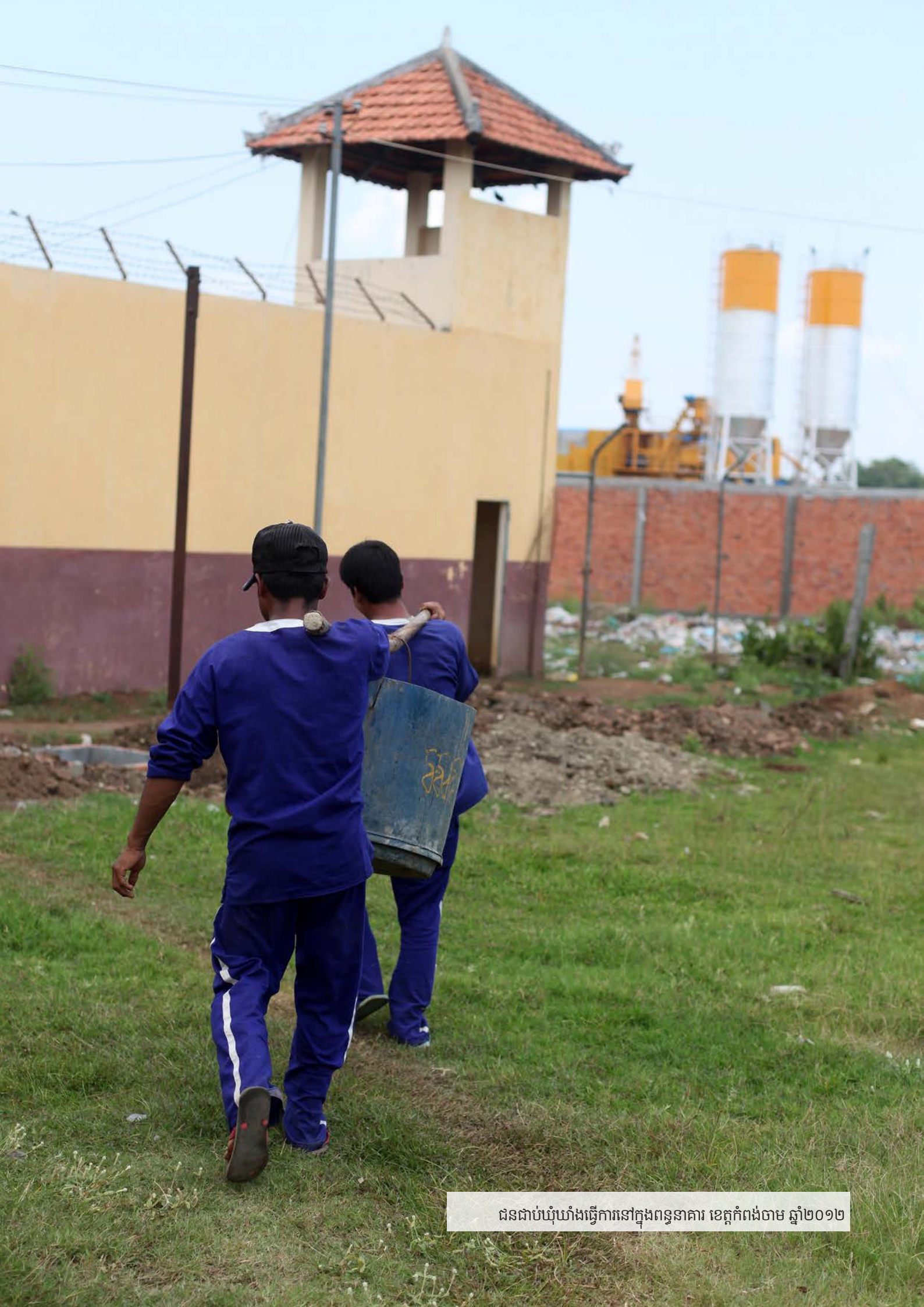
ជនជាប់ឃុំយ៉ាងធ្វើការនៅក្នុងពន្ធនាគារ ខេត្តកំពង់ចាម ឆ្នាំ២០១២