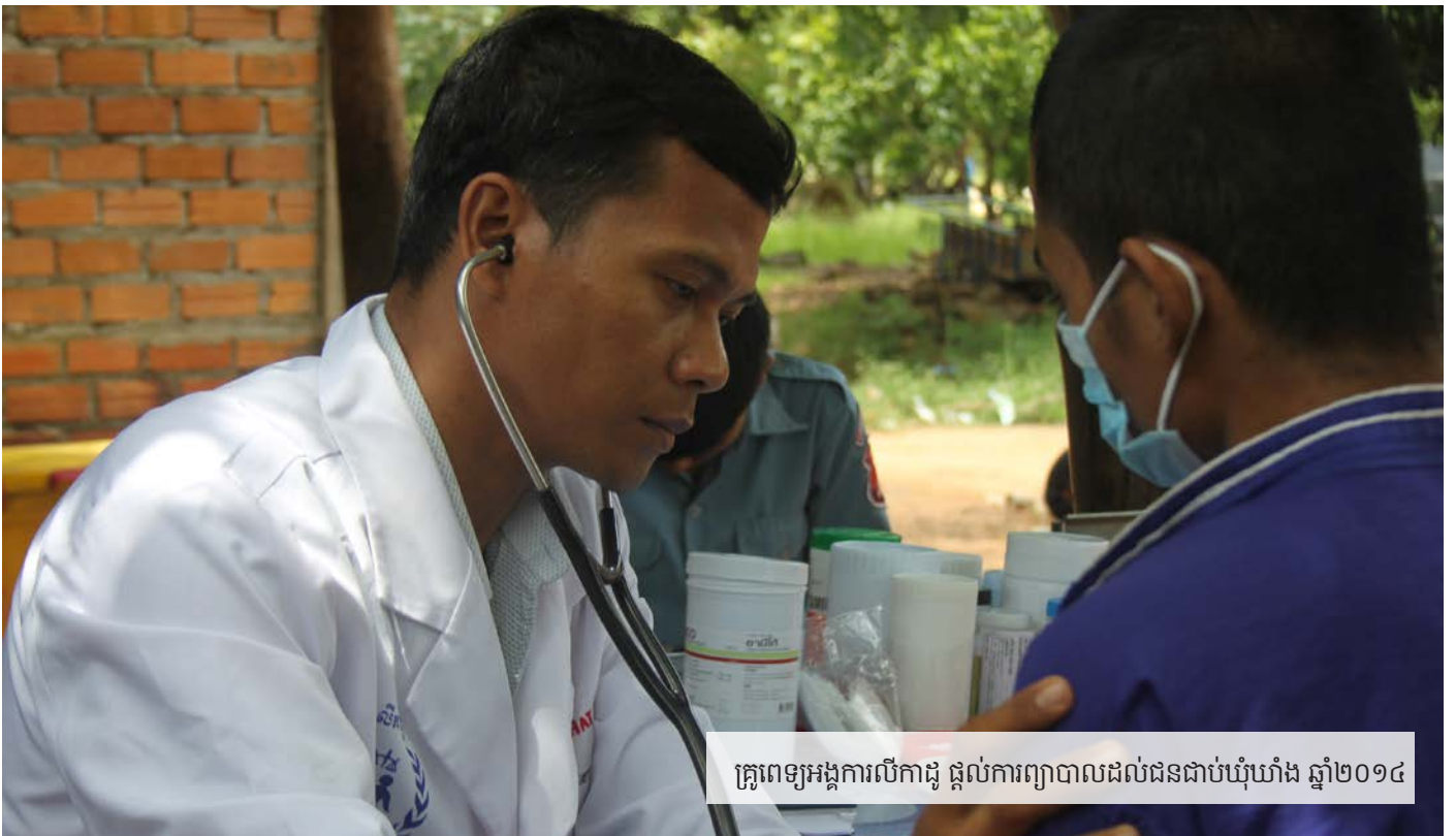
គ្រូពេទ្យអង្គការលីកាដូ ផ្តល់ការព្យាបាលដល់ជនជាប់ឃុំឃាំង ឆ្នាំ២០១៤