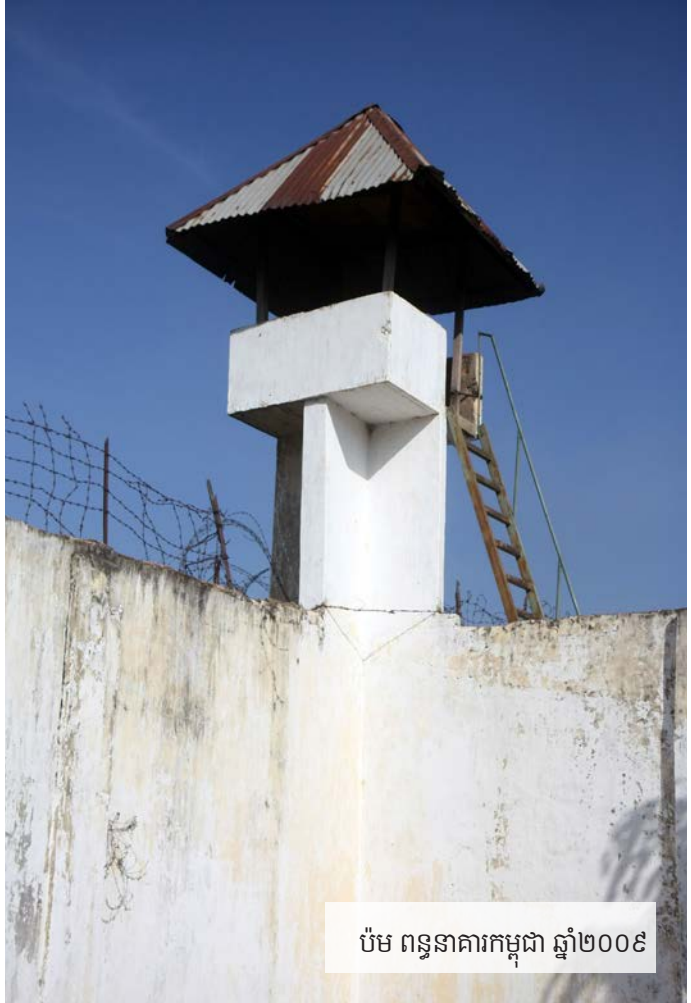
ប៉ម ពន្ធនាគារកម្ពុជា ឆ្នាំ២០០៩

ជាអកុសល យើងមិនអាចដឹងអំពីកម្រិតនៃការគំរាមកំហែង ការបំភិតបំភ័យ និង ការស្តុកប៉ាន់ ដែលត្រូវបានធ្វើឡើង ក្នុងការរារាំងការទទួលព័ត៌មានរបស់អង្គការមិនមែនរដ្ឋាភិបាល ទាក់ទងនឹងស្ថានភាពនៅក្នុងពន្ធនាគារនោះទេ។ ប៉ុន្តែទោះជាយ៉ាងណា យោងតាមចម្លើយ ដែលទទួលបានកន្លងមក អង្គការលើកាដូ ព្រួយបារម្ភថា ការអនុវត្តន៍បែបនេះមានភាពរីកដុះដាល។