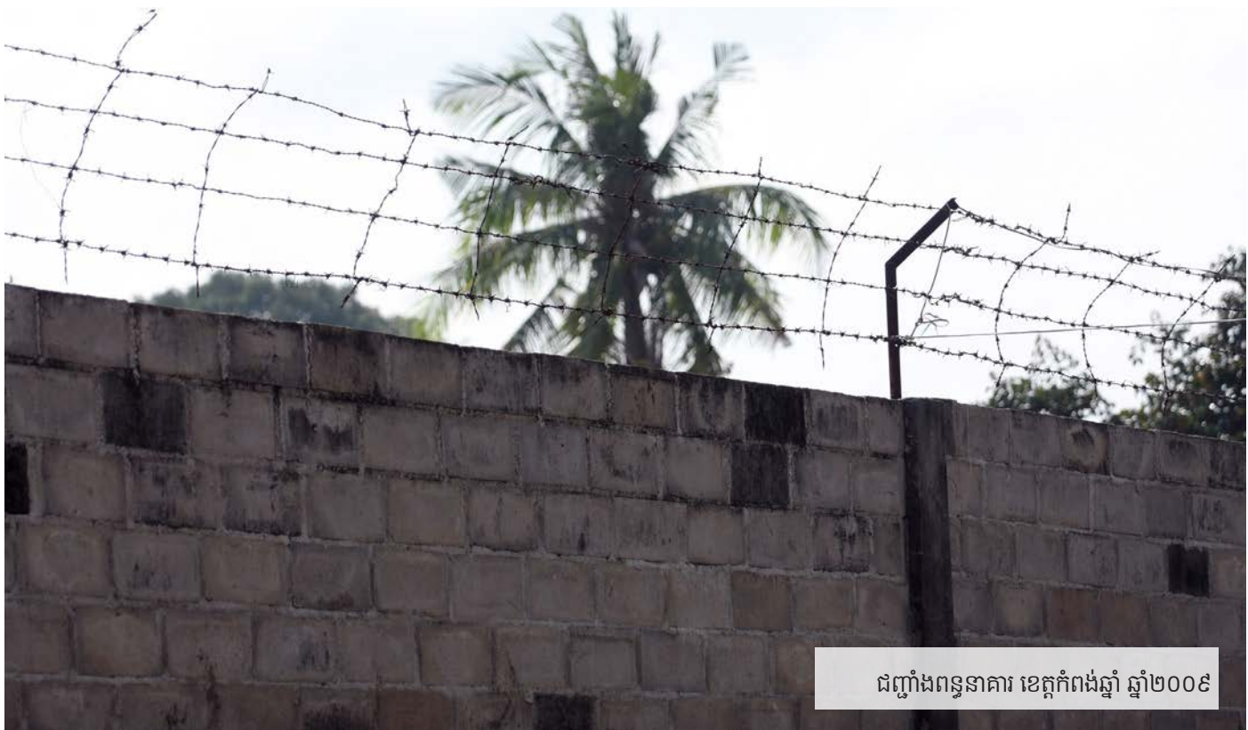
ជញ្ជាំងពន្ធនាគារ ខេត្តកំពង់ឆ្នាំ ឆ្នាំ២០០៩

ទិន្នន័យរបស់អង្គការលីកាដូ បង្ហាញថា ភាគច្រើននៃអ្នក ដែលបានរាយការណ៍អំពី ភាពឃោឃៅរបស់នគរបាល និងមន្ត្រី ពន្ធនាគារ បានរៀបរាប់ថា ខ្លួនត្រូវបានគេ វាយ ទាត់ ធ្លាក់ ទះកំផ្លៀង ផាស់ ហើយជាញឹកញាប់ រហូតដល់ពួកគាត់ ហូរឈាម ឬ បាត់បង់