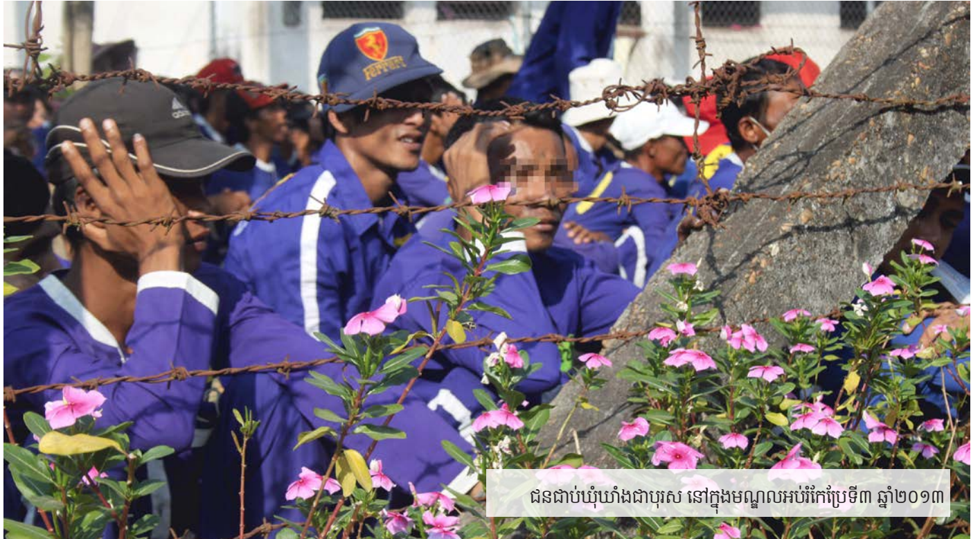
ជនជាប់ឃុំយ៉ាងជាបុរស នៅក្នុងមណ្ឌលអប់រំកែប្រែទី៣ ឆ្នាំ២០១៣

ពន្ធនាគារដែលប្រសើរជាងមុននៅកម្ពុជា។ ទោះបីយ៉ាងណាក៏ដោយ អង្គការលីកាដូ នៅតែមានការព្រួយបារម្ភខ្លាំង ចំពោះស្ថានភាពនៅក្នុងពន្ធនាគារជាច្រើន និង បញ្ហាបន្ត ដែលមានដូចជាការរំលោភបំពាន ការរើសអើង ការកេងប្រវ័ញ្ច និងអំពើពុករលួយក្នុងប្រព័ន្ធពន្ធនាគារ។ របាយការណ៍នេះ បញ្ជាក់ទៅរួមជាមួយអនុសាសន៍មួយចំនួន ជូនចំពោះអាជ្ញាធរកម្ពុជា ទាក់ទងនឹងរបៀបកែលម្អឲ្យប្រសើរឡើងនូវគោលនយោបាយ និងការអនុវត្តន៍ ដើម្បីលើកកម្ពស់ និងការពារឲ្យបានពេញលេញនូវសិទ្ធិរបស់ជនជាប់ឃុំ។