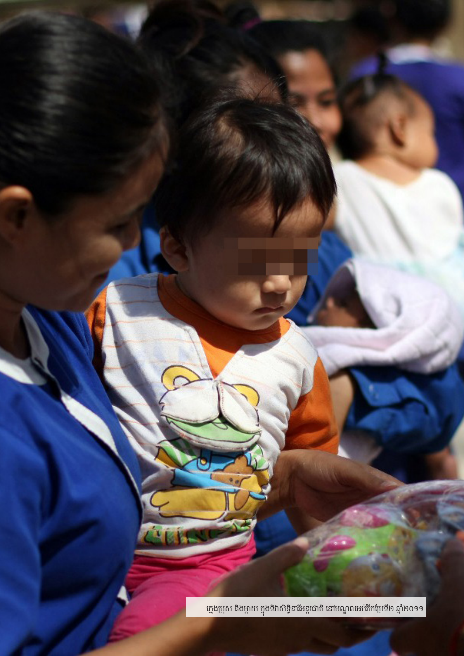
ក្មេងប្រុស និងម្តាយ ក្នុងទិវាសិទ្ធិនារីអន្តរជាតិ នៅមណ្ឌលអប់រំកែប្រែទី២ ឆ្នាំ២០១១