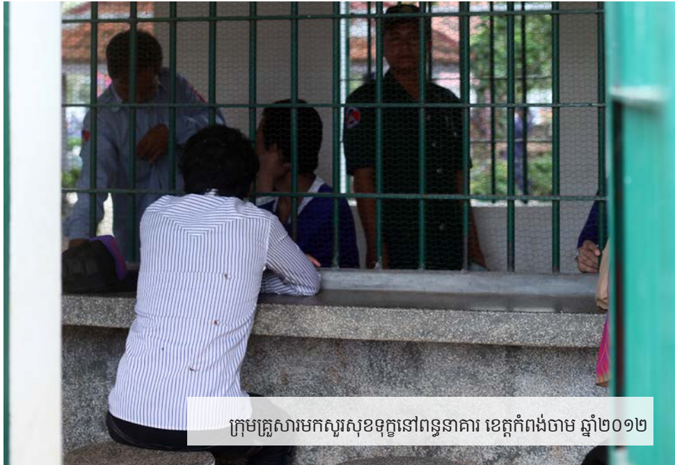
ក្រុមគ្រួសារមកសួរសុខទុក្ខនៅពន្ធនាគារ ខេត្តកំពង់ចាម ឆ្នាំ២០១២