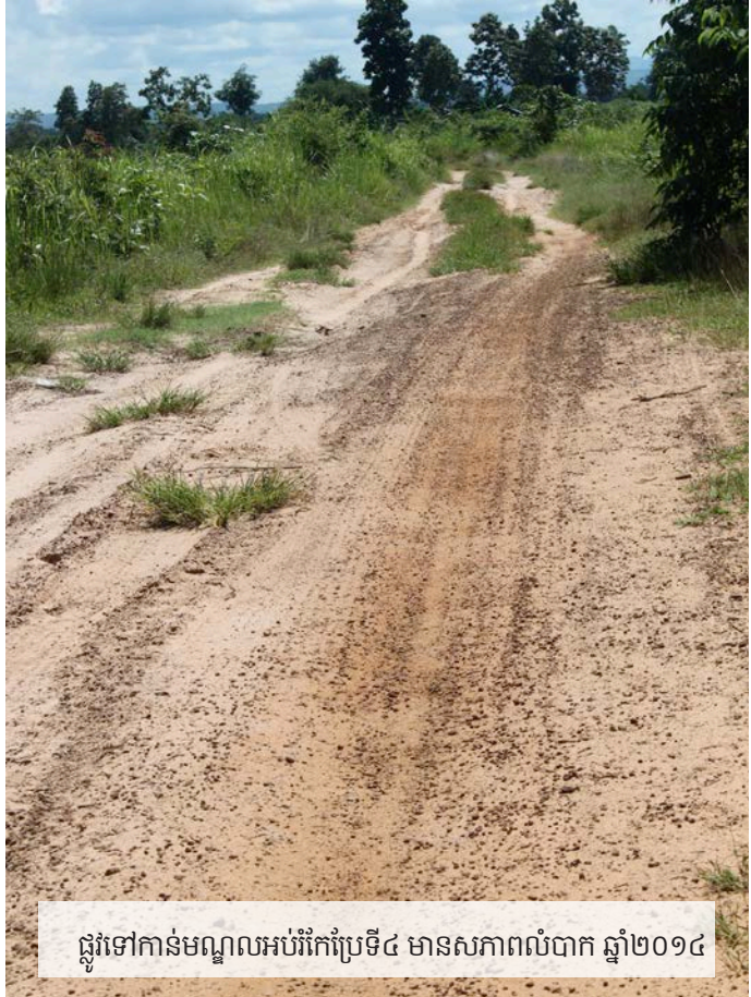
ផ្លូវទៅកាន់មណ្ឌលអប់រំកែប្រែទី៤ មានសភាពលំបាក ឆ្នាំ២០១៤

ថ្វីបើការមកសួរសុខទុក្ខ ពីសំណាក់អ្នកខាងក្រៅមានសារៈ សំខាន់សម្រាប់ជនជាប់ឃុំទាំងអស់គ្នា ផ្ទុយទៅវិញ មានជនជាប់ឃុំ ខ្លះទំនងជាទទួលរងផលប៉ះពាល់ នៅពេលដែលមានការរឹតត្បិតទៅ លើលក្ខខណ្ឌ និងភាពញឹកញាប់នៃការមកសួរសុខទុក្ខ។ ឧទាហរណ៍ ម្តាយ គួរតែត្រូវបានអនុញ្ញាតឲ្យជួបជាទៀងទាត់ និងជួបផ្ទាល់ជាមួយ កូនតូចៗរបស់គាត់ ហើយនៅពេលមានអនីតិជនជាប់ឃុំយ៉ាង វាជា រឿងចាំបាច់ សម្រាប់ពួកគាត់ក្នុងការបន្តរក្សាទំនាក់ទំនងជាមួយ ក្រុមគ្រួសាររបស់ពួកគាត់ជាទៀងទាត់និងដោយមិនមានការរឹតត្បិត។ ប៉ុន្តែជាអកុសល ការស្រាវជ្រាវរបស់អង្គការលីកាដូ បង្ហាញថា កត្តា ទាំងអស់ខាងលើនេះ មិនត្រូវបានយកទៅពិចារណានោះទេ ពេល ដែល មន្ត្រីពន្ធនាគារ ទារថ្លៃចូលសួរសុខទុក្ខពីពួកគាត់។