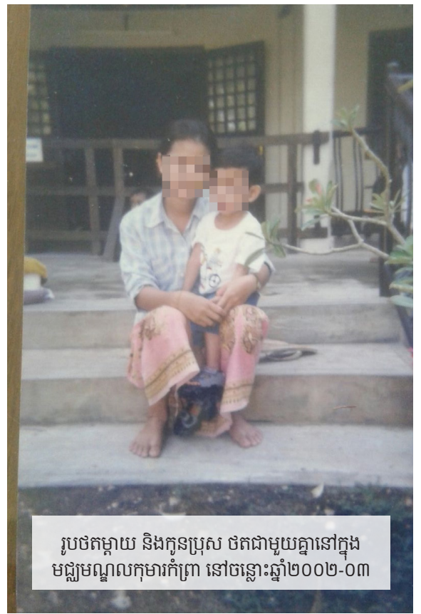
រូបថតម្តាយ និងកូនប្រុស ថតជាមួយគ្នានៅក្នុង មជ្ឈមណ្ឌលកុមារកំព្រា នៅចន្លោះឆ្នាំ២០០២-០៣

កូនជាមួយនាងទេ ឬ ក៏មិនបានស្នើឲ្យនាងចុះហត្ថលេខា លើឯកសារ ណាមួយដែរ។ ពីរបីសប្តាហ៍ ក្រោយមក ប្រធានមណ្ឌលកុមារកំព្រា បានប្រាប់ ឲ្យនាងជាម្តាយដឹង ថា ពួកគេ នឹងបញ្ជូនទារកទៅកាន់ទីក្រុងបាងកក ដើម្បី ទទួលការព្យាបាល។ ទារកនោះ បានទទួលការព្យាបាល នៅទីនោះរយៈពេលប្រហែលមួយសប្តាហ៍ ហើយបន្ទាប់ពី ត្រឡប់មកវិញ ស្ថានភាពរបស់ទារកបាន ប្រសើរឡើង