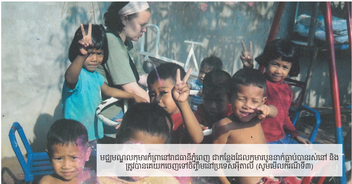
មជ្ឈមណ្ឌលកុមារកំព្រាជានៅភ្នំពេញ ជាកន្លែងដែលកុមារបួននាក់ធ្លាប់បានរស់នៅ និង ត្រូវបានគេយកចេញទៅចិញ្ចឹមនៅប្រទេសអ៊ីតាលី (សូមមើលករណីទី៣)

ចំណែកករណីទីបីគឺ ដោយសារកុមារនោះ មានជំងឺ ធ្ងន់ធ្ងរខ្លាំង ហើយត្រូវការការថែទាំ ឲ្យបានជិតដល់ដែល ម្តាយកូននោះ មិនមានលទ្ធភាពផ្តល់ឲ្យបាន ពីព្រោះស្ត្រីជា ម្តាយជាកម្មកររោងចក្រកាត់ដេរ។ មិនមានករណីណាមួយ ដែលម្តាយបានបោះបង់កូនខ្លួននោះទេ ហើយក៏គ្មាន ករណីណាដែលម្តាយទាំងនោះ បានផ្តល់សិទ្ធិឲ្យគេ យក កូនទៅចិញ្ចឹមនោះដែរ។ អង្គការលីកាដូ បានឃ្នាំមើលលើ ករណីទាំងបីនេះ និងបានរកឃើញថា សកម្មភាពសុំកូន ទាំងនេះ ត្រូវបានធ្វើឡើង ដោយការក្លែងបន្លំ និងមិន ខ្វល់ពីសិទ្ធិ និងអារម្មណ៍របស់ក្រុមគ្រួសាររបស់កុមារ។