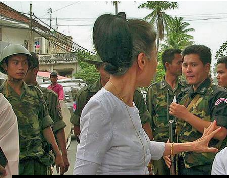
កងប៉ូលីសបង្ក្រាបបាត់មុខជំនាញដើម្បីបំបែកក្រុមបាតុករ ។

អង្គការឃ្នាំមើលសិទ្ធិមនុស្ស មានជំនឿថាឆ្នាំ២០០៥ បង្ហាញពី "ការធ្លាក់ចុះយ៉ាងខ្លាំង" ដែលកម្ពុជាសំរេចបានកន្លងមកក្នុងការគោរពសិទ្ធិមនុស្ស និងស្ថាបនារបបនយោបាយពហុបក្ស ចាប់តាំងពីការចុះហត្ថលេខាកិច្ចព្រមព្រៀងសន្តិភាពទីក្រុងប៉ារីសឆ្នាំ១៩៩១ ។ អង្គការឃ្នាំមើលសិទ្ធិមនុស្ស បានធ្វើការកត់សំគាល់ថា "គណបក្សនយោបាយជំនាន់ត្រូវបានបំបែកបំបាក់ដោយជោគជ័យតាមរយៈការចាប់ខ្លួន ឬការគំរាមចាប់ខ្លួនអ្នកតំណាងរាស្ត្រ ។ សកម្មជន និងអ្នកសារព័ត៌មាន ដែលហ៊ាននិយាយអំពីការបន្តិចបន្តួចអូសយកដីរបស់កសិករ ការកាប់ព្រៃឈើខុសច្បាប់ ឬសន្តិសញ្ញាព្រំដែនប្រកបដោយភាពច្របូកច្របល់ជាមួយប្រទេសវៀតណាម ត្រូវបានចាប់ខ្លួន វាយធ្វើបាបលើរូបរាងកាយ ឬគំរាមដល់អាយុជីវិត ឬចោទប្រកាន់ និងដាក់ពន្ធនាគារ ដោយចោទពីបទបរិហារកេរ្តិ៍មិនត្រឹមត្រូវ" ៤ ។ អង្គការលើកលែងទោសអន្តរជាតិបានរាយការណ៍ថា ការរឹតត្បិតដោយសន្តិភាពលើរដ្ឋាភិបាលត្រូវបានចុះថយ ដោយសារអ្នកការពារសិទ្ធិមនុស្ស និងអ្នកនយោបាយរបស់គណបក្សជំនាន់ត្រូវប្រឈមមុខនឹងការគំរាមកំហែង ហើយការរឹតត្បិតលើសេរីភាពក្នុងការជួបជុំគ្នានៅតែបន្ត ។ របាយការណ៍នេះបានផ្តោតទៅលើ "អំពើពុករលួយ និងប្រព័ន្ធតុលាការទន់ខ្សោយរបស់កម្ពុជា" ការរំលោភលើអនុសញ្ញាឆ្នាំ១៩៥១ ស្តីពីជនភៀសខ្លួន និងការផ្តល់ដីសម្បទានដោយរដ្ឋាភិបាល ដែលធ្វើឱ្យប្រជាពលរដ្ឋកម្ពុជានៅតែបន្តការបាត់បង់ដីធ្លី និងរស់នៅក្នុងស្ថានភាពក្រីក្រ ៥ ។