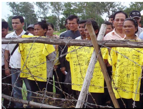
ក្រុមគ្រួសារជនរងគ្រោះដែលត្រូវចាប់ខ្លួនពេលមានការបណ្តេញដោយអំពើហិង្សាត្រូវបានរារាំងនៅ តាមផ្លូវពេលមានដង្ហែរ ក្នុងទម្រង់ទារឱ្យដោះលែងពួកគេ ។

ក្នុងករណីនេះ អំពើវាយប្រហារមានជាច្រើនទម្រង់ខុសៗគ្នា ចាប់ពីការគំរាមដោយពាក្យសំដី និងការយាយីតិចតួចរហូតដល់ការវាយដំលើរាងកាយធ្ងន់ធ្ងរ ជាពិសេសនៅពេលប្រតិបត្តិការបណ្តេញដោយហិង្សា ។ យុទ្ធសាស្ត្ររួមដែលជនល្មើសចូលចិត្តប្រើក្នុងករណីសំខាន់ៗ គឺកំណត់មុខសញ្ញាដែលជាតំណាងរបស់សហគមន៍ដែលពាក់ព័ន្ធ ហើយមានបំណងចាប់និងឃុំខ្លួនដោយចោទប្រកាន់មូលបង្កាច់ពីបទព្រហ្មទណ្ឌ ។ ក្នុងករណីមួយចំនួនទៀត ការចោទប្រកាន់បានផ្អែកទៅលើការសន្មត់ថាសហគមន៍រំលោភបំពានកម្មសិទ្ធិរបស់អ្នកដទៃ ។ នៅពេលមានជំលោះសំខាន់បំផុតនៅត្រង់ថា តើនរណាជាម្ចាស់កម្មសិទ្ធិលើដីនោះពិតប្រាកដ ដែលបញ្ហានេះត្រូវសំរេចដោយតុលាការ ។ តាមការត្រួតពិនិត្យលើបទចោទប្រកាន់ករណីព្រហ្មទណ្ឌ ជាញឹកញាប់បង្ហាញពីចេតនាមិនអនុវត្តច្បាប់ ដូចជា ច្បាប់ភូមិបាលឆ្នាំ២០០១ និងច្បាប់ព្រៃឈើឆ្នាំ២០០២ ។ ក្នុងករណីដទៃទៀត ការចោទប្រកាន់ពាក់ព័ន្ធយ៉ាងតិចតួច ឬគ្មានពាក់ព័ន្ធទាស់តែសោះជាមួយបញ្ហាទំនាស់ ។ ទោះបីជាសកម្មជនត្រូវបានដោះលែងជាបណ្តោះអាសន្ន ក៏បទចោទប្រកាន់លើពួកគេនៅតែតំកល់ទុកនៅឯស្ថាប័នតុលាការក្នុងរយៈពេលវេលាមិនកំណត់មួយ ២២ ។